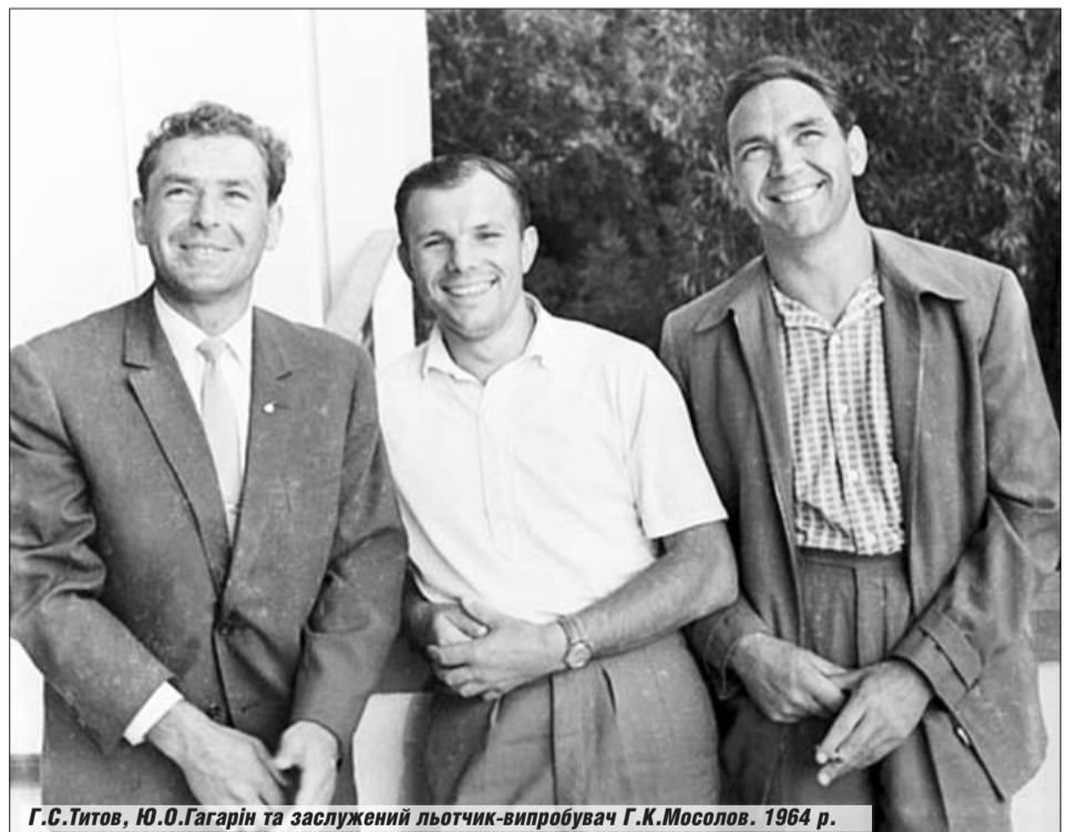
Г.С.Титов, Ю.О.Гагарін та заслужений льотчик-випробувач Г.К.Мосолов. 1964 р.

Отримані травми надовго прикупи Георгія Мосолова до лікарняного ліжка. Невдовзі лікарі дозволили відвідувати його, і серед перших до пораненого друга прийшов Юрій Гагарін.